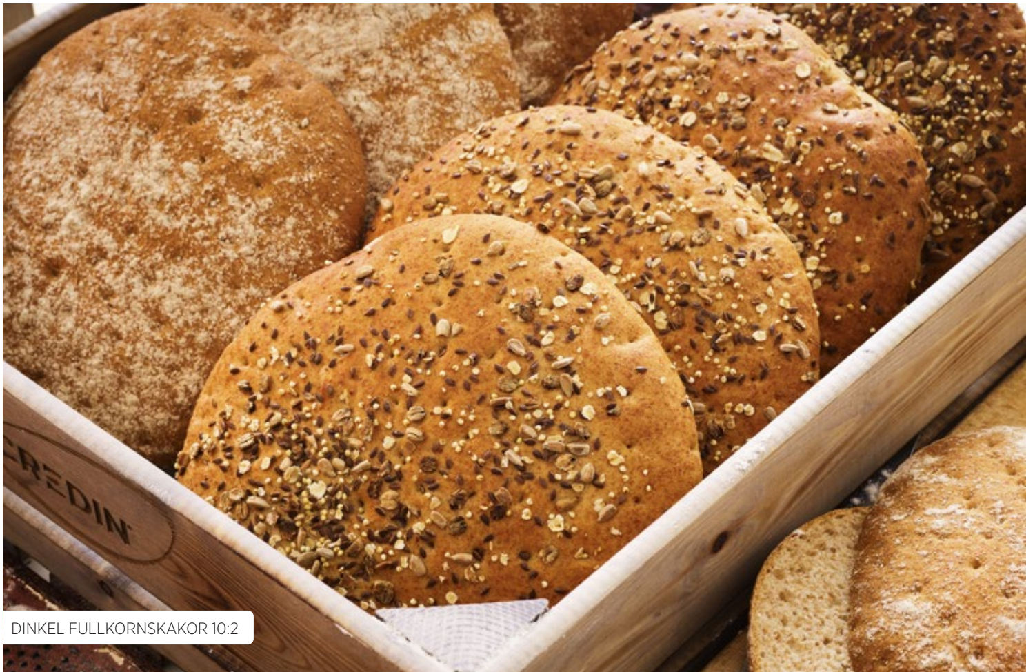
DINKEL FULLKORNSKAKOR 10:2