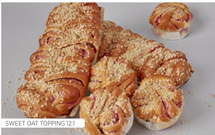
SWEET OAT TOPPING 12:1

2705..... QUICKANSLAG CHOKLAD..... 10 KG Mix för tillverkning av chokladanslag och drömtårtsbotten. Du tillsätter endast ägg och vatten.