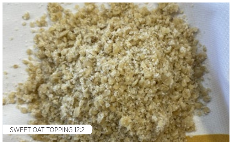
SWEET OAT TOPPING 12:2