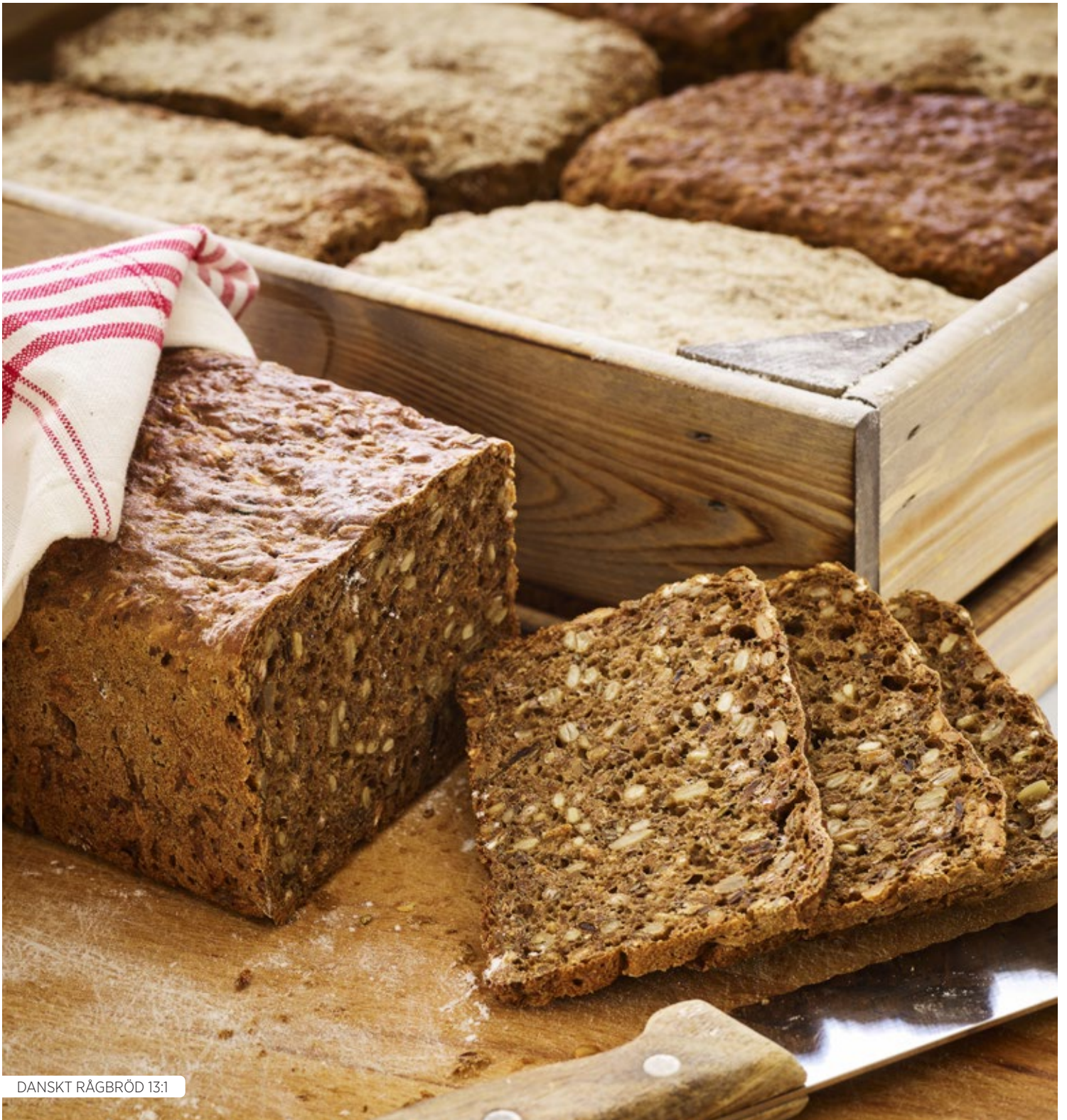
DANSKT RÅGRÖD 13:1